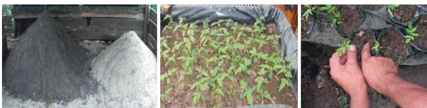
Figura 2. Muestras del sustrato utilizado en el ensayo y plántulas de las semillas sembradas

Las platabandas y fundas fueron regadas frecuentemente y cuidadas para evitar el ataque de plagas y animales domésticos, también se realizó limpieza de plantas no deseadas.