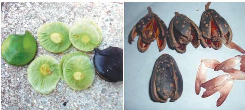
Figura 1. Frutos y semillas de remo Aspidosperma laxiflorum y cedro Cedrela odorata

100 semillas por cada especie, eligiendo las que tenían mayor tamaño y buen estado de madurez. Se usó el método de la flotación para evitar las semillas infértiles.