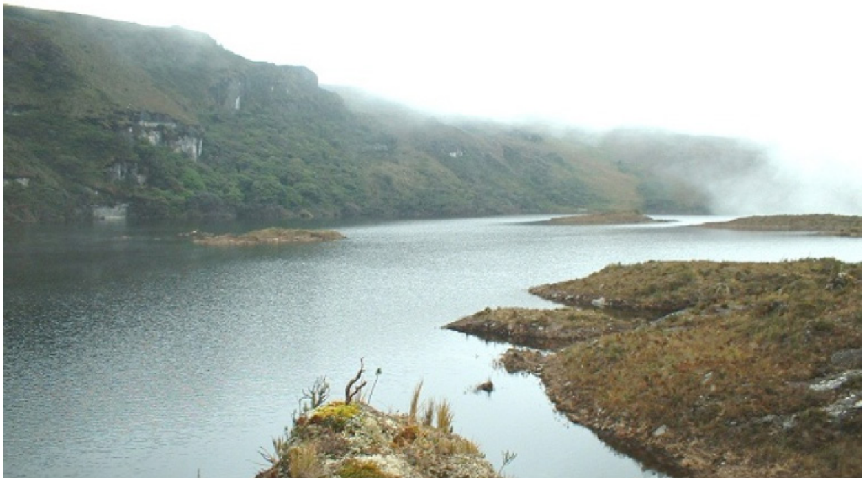
Figura 2. Panorámica de la Laguna de Chinchilla

Ubicado a 3600 msnm, en pleno páramo herbáceo de la cordillera de Chilla, es un lugar mágico con una belleza espectacular dada por la presencia de formaciones rocosas producto de antiguas exploraciones mineras, erosión hídrica y eólica. Se diferencian cuevas, arcos, pla-