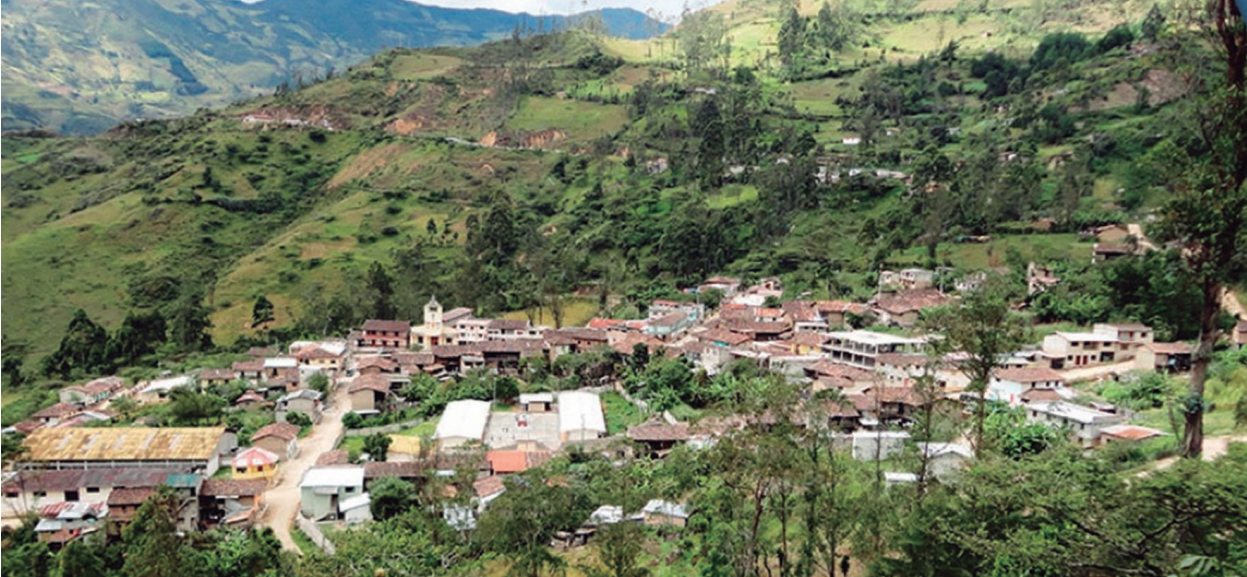
Figura 1. Panorámica de la parroquia Manu, Saraguro Loja.

Historia y características de la población parroquial San Antonio de Manú (ver figura 1) es una parroquia muy antigua, su fundación española data de los años 1700 y reconocida jurídicamente el 29 de mayo de 1861. La aseveración de fundación española esta argumentada en los diferentes apellidos de familias que han habitado y habitan esta población (GAD Manú, 2014; Vásquez, 2013).