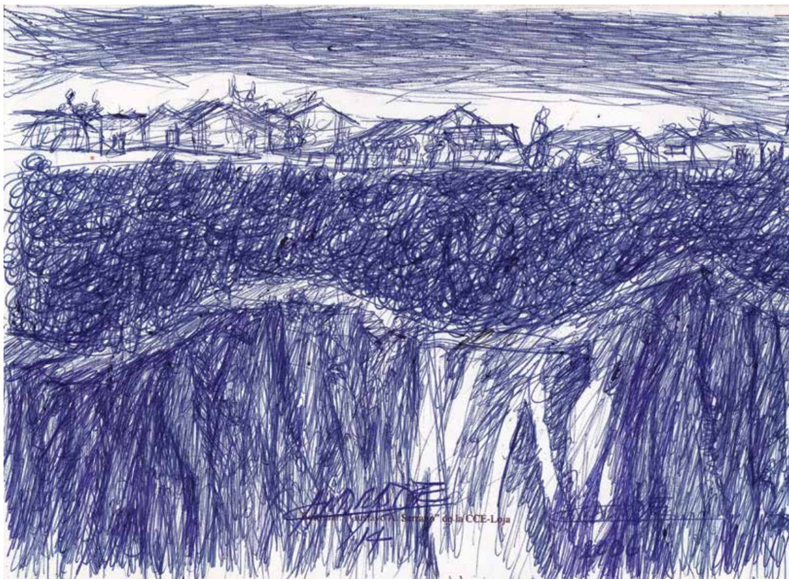
Sin título Bolígrafo sobre papel 18 cm. X 13 cm.