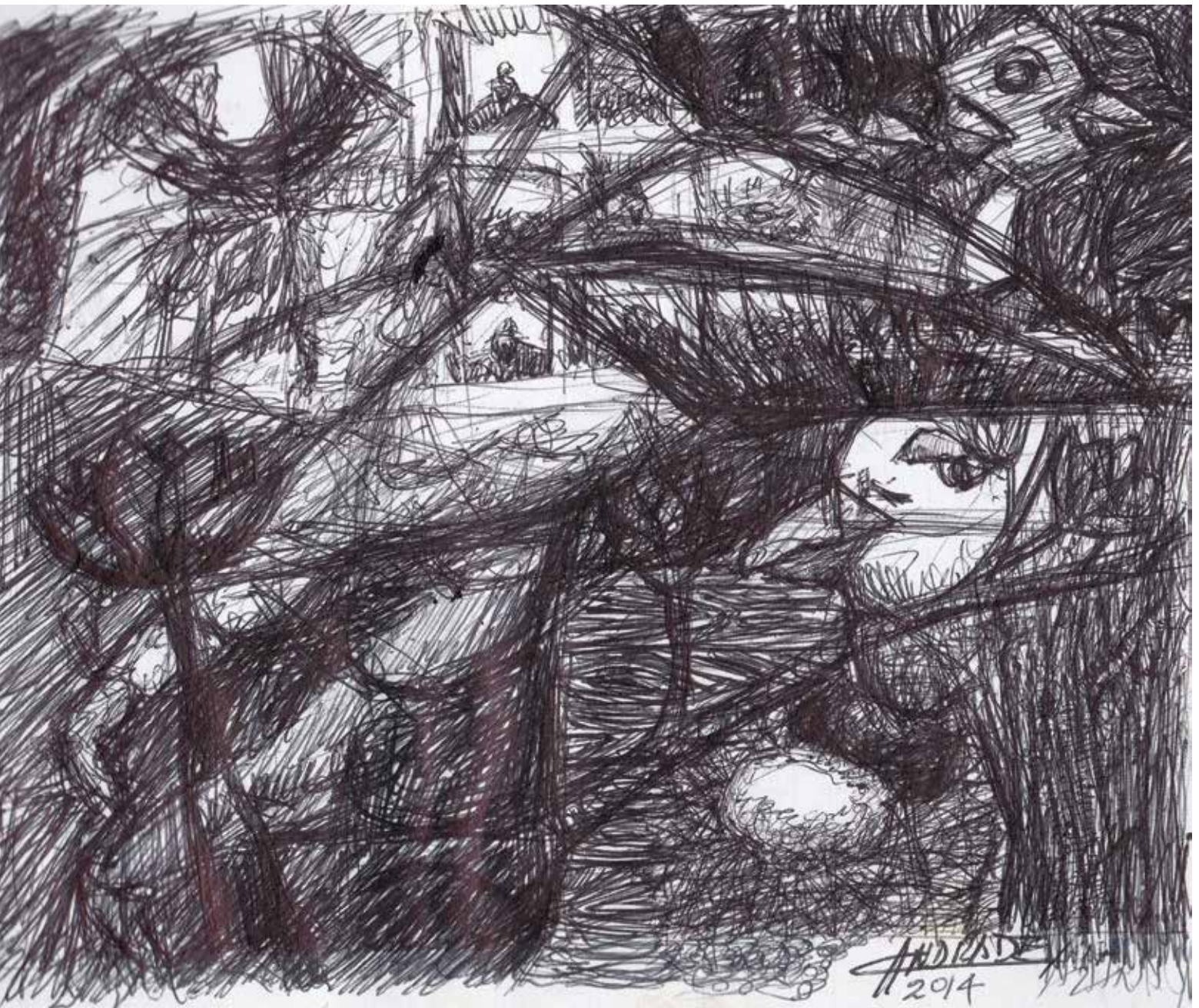
Sin título Bolígrafo sobre papel 18 cm. X 13 cm.