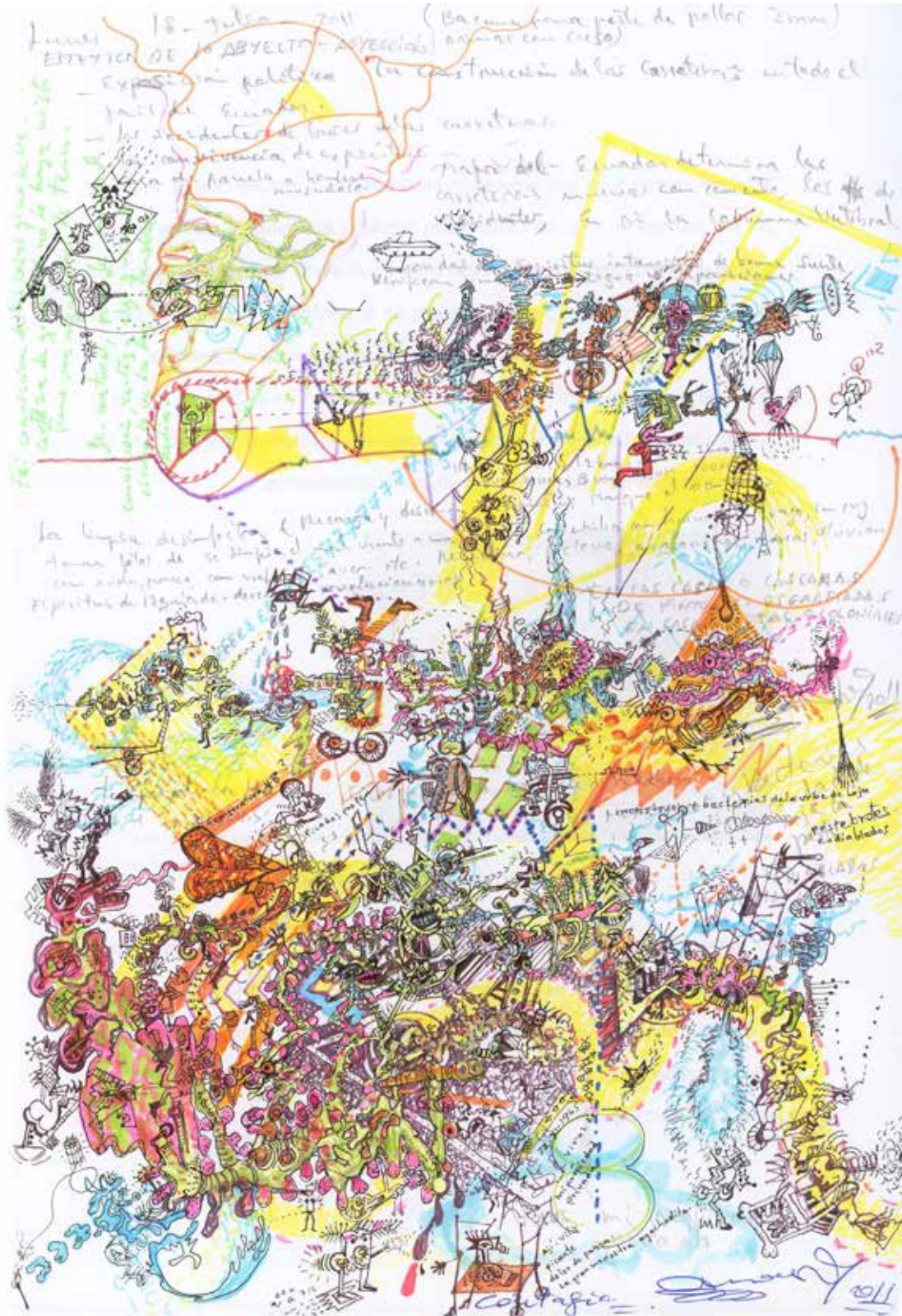
01 Abyección y Ardiente. Grafito, tinta y marcadores sobre papel. 210 X 297 Mm.