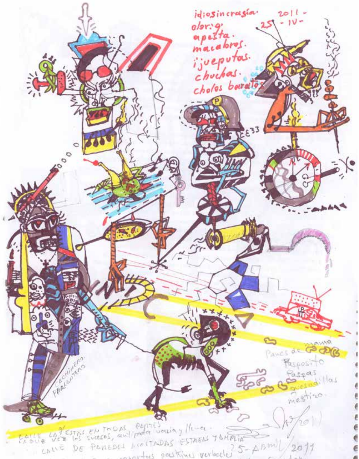
06 Muecas De Achote a la carta Grafito y marcadores sobre papel 210 X 297 Mm.