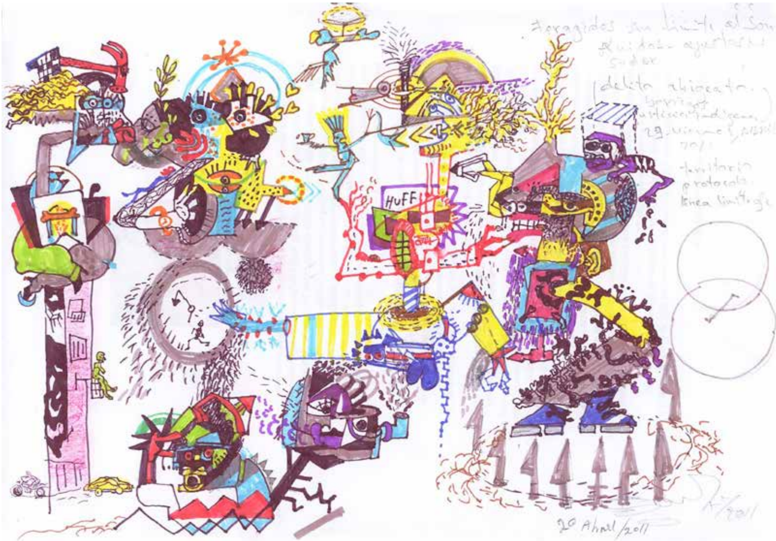
10 Loco, Marca Tu Territorio. Grafito y marcadores sobre papel 210 X 297 Mm.