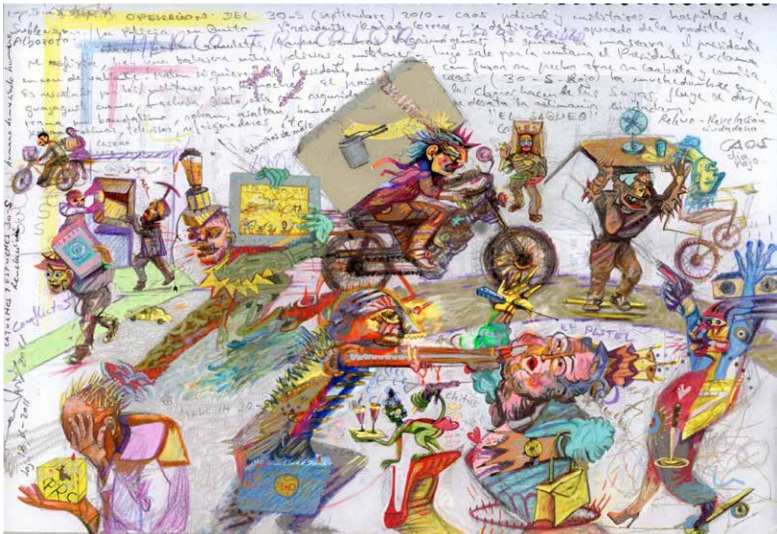
09 Brindis y Desengrasados 30-S, 2010 Grafito, dibujo en papel, escaneado y resolución digital 210 X 297 Mm.