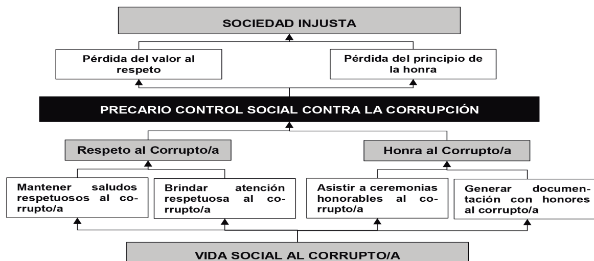
Gráfico 1: Árbol de problemas aplicado a la situación de corrupción en el Perú.