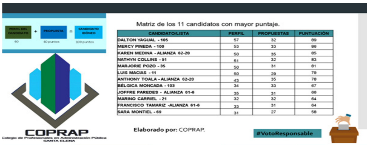
Ilustración No.- 3 Análisis y evaluación de candidatos concejales del cantón La Libertad

Los datos reflejados en la ilustración indican los 12 candidatos con mayor puntuación obtenida en las mesas de trabajo realizada, valores obtenidos de acuerdo al modelo determinado para la evaluación de los candidatos idóneos.