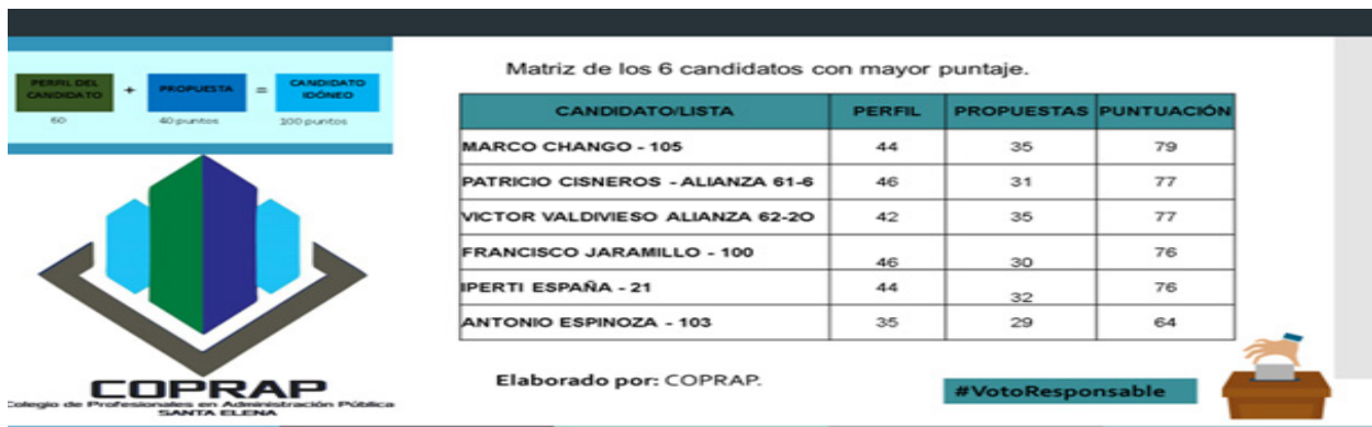
Ilustración No.- 2 Análisis y evaluación de candidatos a alcalde del cantón La Libertad