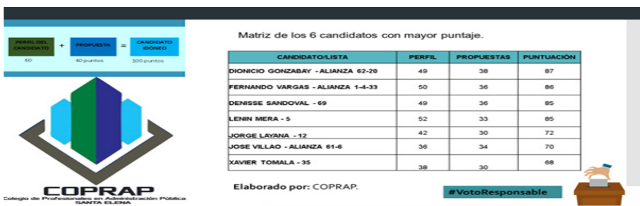
Ilustración No.- 6 Análisis y evaluación de candidatos a prefecto de la provincia de Santa Elena.

Los datos reflejados en la ilustración indican los 6 candidatos con mayor puntuación obtenida en las mesas de trabajo realizada, valores obtenidos de acuerdo al modelo determinado para la evaluación de los candidatos idóneos.