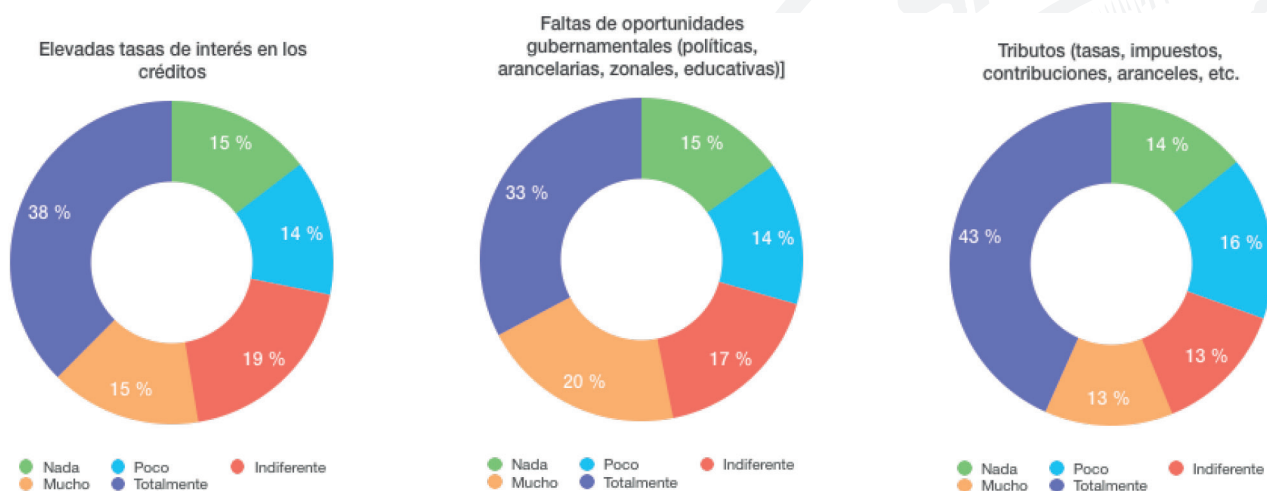
Gráfico 4: Variables más relevantes que impiden el crecimiento empresarial

Fuente Encuesta realizada a los Microempresarios de la ciudad de Loja Elaboración: Los autores