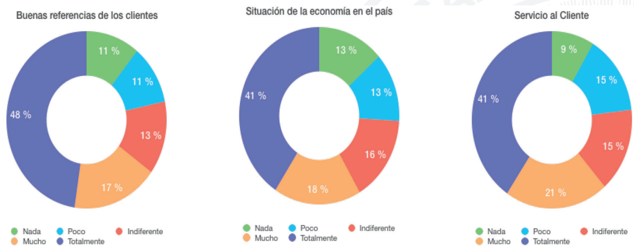
Gráfico 2: Variables más relevantes que inciden en el crecimiento empresarial